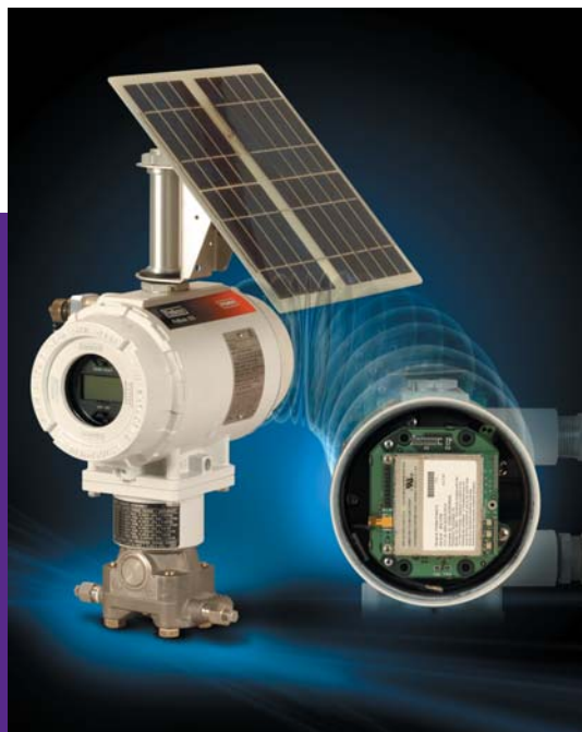
FloBoss 103 с дополнительной солнечной панелью мощностью 5 Ватт и встроенным радиомодемом.

FloBoss™ 103 Flow Manager – это компактный автономный контроллер расхода на один поток, позволяющий выгодно заменить традиционные бумажные самописцы, широко используемые в газовой промышленности.